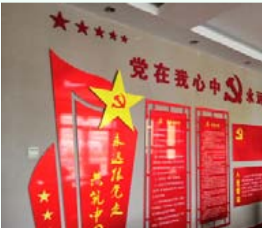
P21 党建引领教书育人 开启“红色基因”传承新途径