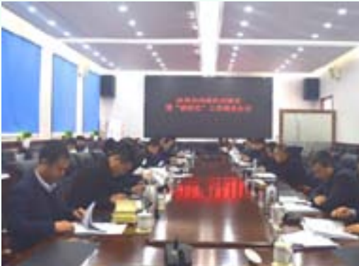
P18 解放思想抓党建 筑强堡垒促发展